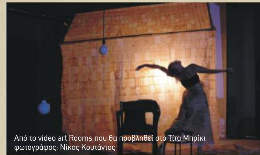
Από το video art Rooms που θα προβληθεί στο Ίττα Μηρίκι

κινησιολογική έρευνα που ξεκίνησε ο Steve Paxton στην Αμερική σε συνεργασία με την ομάδα "Magnesium" που αρχικά αποτελούταν από 13 άντρες. Πρόκειται για την επικοινωνία που δημιουργείται μεταξύ δύο, ή και περισσότερων ατόμων, μέσα από τη σωματική επαφή, τις δυνάμεις της φυσικής, τη βαρύτητα, την προσεγγισμένη ορμή, τη συνεχόμενη ροή, τη δράση-αντίδραση και το απρόβλεπτο της στιγμής. Είναι ένας αυτοσχεδισμός χορός όπου τα σώματα συνυπάρχουν σε μια μοναδική οντότητα, ένα σύμπλεγμα κινήσεων που συνεχώς εξελίσσεται και αναπλάθεται μέσα στο χώρο και τον χρόνο. Το εκπληκτικό του Contact Improvisation είναι από τη μια μεριά οι τεχνικές απαιτήσεις του πάνω στο κομμάτι του χορού (δύναμη και πλαστικότητα μαζί, εγρή-