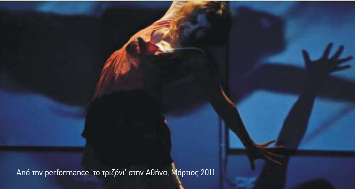
Από την performance 'το τριζόνι' στην Αθήνα, Μάρτιος 2011

Επίσης, μαζί με έναν άλλο συνεργάτη οργανώνουμε ένα φεστιβάλ Contact Improvisation στην πόλη μας για το φθινόπωρο του 2011, ενώ ταυτόχρονα ετοιμάζουμε κάποιες παρουσιάσεις με δουλειές της φυσαλίδας (βίντεο προβολές, τη solo performance “insect”, το “τριζόνι” και μια άλλη χορογραφία) σε Αθήνα (20 Ιουνίου στο Athens Fringe Festival), Ναύπακτο (22, 23 και 24 Ιουνίου στο Διεθνές Συμπόσιο με θέμα “Επικοινωνία της Κρίσης”), Πάτρα (1-8 Οκτωβρίου στο 13ο Διεθνές Φεστιβάλ Κινη-