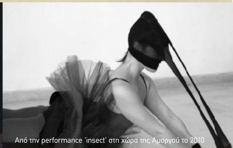
Από την performance 'insect' στη χώρα της Αμοργού το 2010

χνική σε οποιαδήποτε μορφή τέχνης, αυτό σου μαθαίνει. Να μελετάς τη φόρμα, την τεχνική έως ότου την κατακτήσεις και έπειτα να την υπερβείς σπάζοντάς την... Και μετά ξανά το ίδιο. Αυτή η διαδικασία είναι συνεχής κι ατέρμονη... σε μια χορευτική σπείρα! Η αρετή είναι το ταλέντο, το "potential" που λένε... Αρετή στην ψυχή. Όχι μόνο στο κορμί και στο μυαλό, άλλα και στην καρδιά... "Το μυαλό είναι δυνατότερο από το σώμα, και η καρδιά δυνατότερη από το μυαλό". Νομίζω κάπως έτσι είχε ειπωθεί στο "μικρό βουδά", την ταινία του Bertolucci. Και ο παράγοντας της τύχης είναι εξίσου σημαντικός. Αυτό που λέμε "να είσαι εκεί την κατάλληλη στιγμή με τους κατάλληλους ανθρώπους". Θα έλεγα πως το μοιραίο έχει μια μεταφυσική υπόσταση στη ζωή μας... Χωρίς αυτό βέβαια να σημαίνει πως είμαστε έρμαιοι της μοίρας. Πιστεύω πως και γεννιόμαστε και γινόμαστε. Στις δουλειές μου, μου αρέσει να κάνω συχνά αναφορά στις τρεις μοίρες... Τις θεωρώ σημαντική πηγή έμπνευσης.