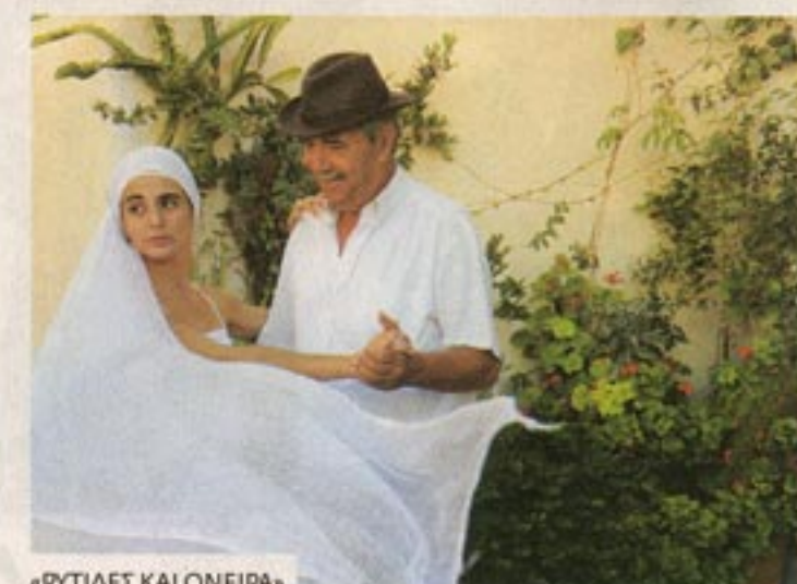
«ΡΥΤΙΔΕΣ ΚΑΙ ΟΝΕΙΡΑ»

Πολλοί Έλληνες σκηνοθέτες θα απέχουν από τα 50στά γενέθλια του Φεστιβάλ της Θεσσαλονίκης. Υπάρχουν όμως και κάποιοι που θα είναι εκεί